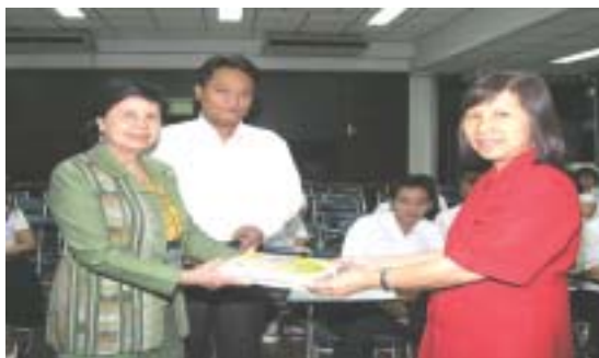
วันที่ 17 พฤศจิกายน 2547 อาจารย์และนักศึกษา โปรแกรมบริหารวิชาคณะวิทยาศาสตร์ มหาวิทยาลัยราชภัฏจันทรเกษม (24 คน) ศึกษาดูงานเรื่อง “แหล่งข้อมูลเพื่อการสืบค้นทางชีววิทยา”