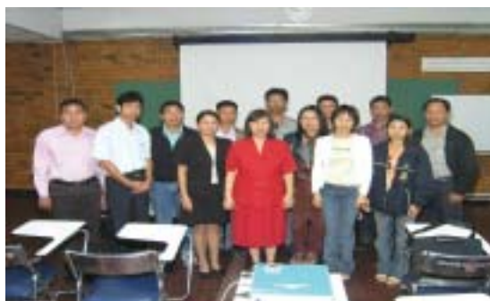
วันที่ 2 ธันวาคม 2547 อาจารย์และนักศึกษา โครงการบัณฑิตศึกษา สาขาพุทธศาสตร์การพัฒนาศาสตร์ มหาวิทยาลัยราชภัฏสกลนคร (30 คน) ศึกษาดูงานเรื่อง “ข้อมูลวิทยานิพนธ์เพื่อการวิจัยและการบริการของสำนักหอสมุด”