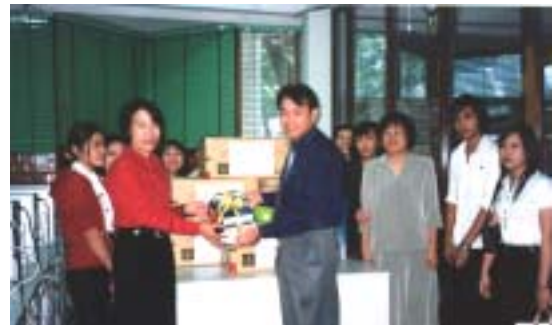
วันที่ 18 พฤศจิกายน 2547 โครงการ ห้องสมุดชุมชน สำนักหอสมุด ได้มอบหนังสือ 1,166 เล่ม CD 10 แผ่น หลอดไฟฟ้า 200 หลอด บัลลาศด 200 ตัว ชมหนังสือ (จากบริษัทปูนซิเมนต์ไทยจำกัด) 5 ชั้น และวัสดุอื่นๆ อีกจำนวนหนึ่ง แก่ โรงเรียนหนองไม้แก่นวิทยา อ.แปลงยาว จ.ฉะเชิงเทรา เพื่อส่งเสริมการเรียนการสอนของโรงเรียน