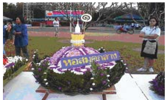
วันที่ 26 พฤศจิกายน 2547 หอสมุดกลางได้ร่วมงานประกวดกระทงประเภทสวยงาม