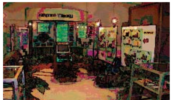
ครบรอบ 25 ปี วันที่ 12 พฤศจิกายน 2547 หอสมุดกลาง ได้รวมจัดนิทรรศการเรื่อง “สานอดีตสู่ปัจจุบันมุ่งมั่นสู่นาคต”